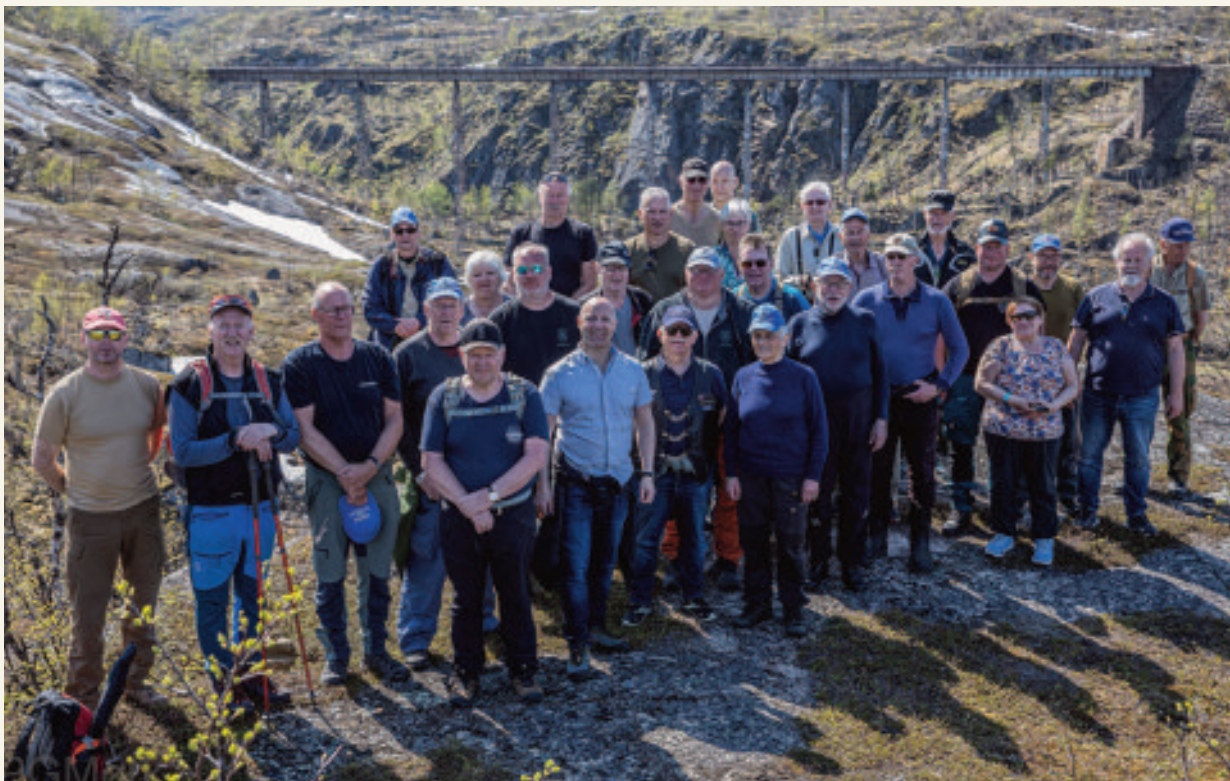
Rallarveien med Norddalsbrua. Her kan den glade veteran gå Norge på tvers i løpet av 4-5 timer.