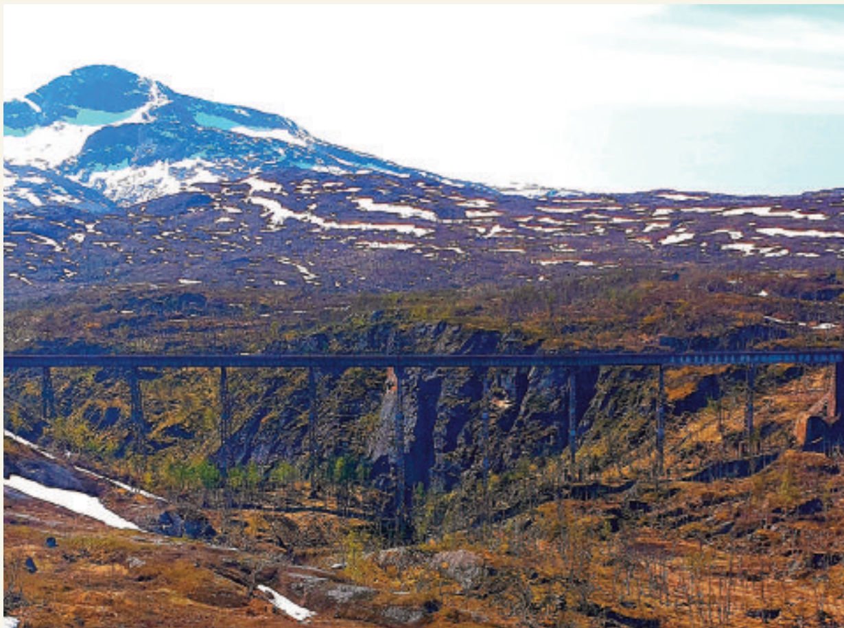
The Bridge", Norddalsbrua som sto ferdig august 1902 etter fem måneders konstruksjonsarbeid. 170 meter lang og 40 meter høy. Ikke så lett å sprengre som opprinnelig tenkt, viste det seg i 1940.