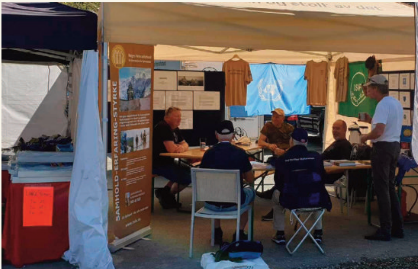
Flott med besøk på stand.